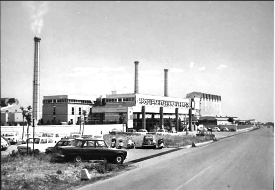
Fig. 2. San Salvo negli anni Settanta.